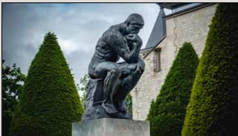
Le Penseur - Auguste RODIN